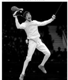
雷声夺冠后兴奋呐喊