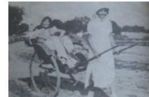
刚入校的燕大学生拉着师姐逛海淀

另一个用以教训新生、杀掉他们锐气的惯例是刚入校的新生用黄包车拉着高年级的老生在燕园之内或海淀周围走上一大圈。让那些从小娇生惯养、手无缚鸡之力的新大学生出一身大汗，稚嫩的手掌上长几个血泡，以便他们能真正意识到读书、做学问也像干