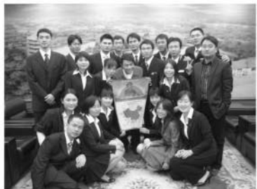
台研会蔡康永先生讲座留影