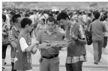
志愿者们为新生和家长服务

“很感谢网球这个项目,它让我变得比自己想象的要强。网球并不是只做好自己的工作就可以赢球的项目