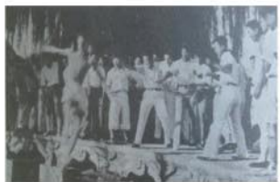
新生“拖尸”典礼，一名男生被扔进了未名湖

果然，两天以后的一个傍晚，大家刚吃完晚饭准备到图书馆去读书的时候，竟听见校园里锣鼓喧天，撞撞响响的声音。只见一长队学生拥着几个男生，拿着毛巾等物，一路朝西校门去。于是大家也忘了读书，