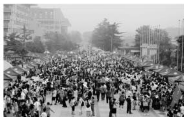
邱悦体育馆北广场上新生集中报到